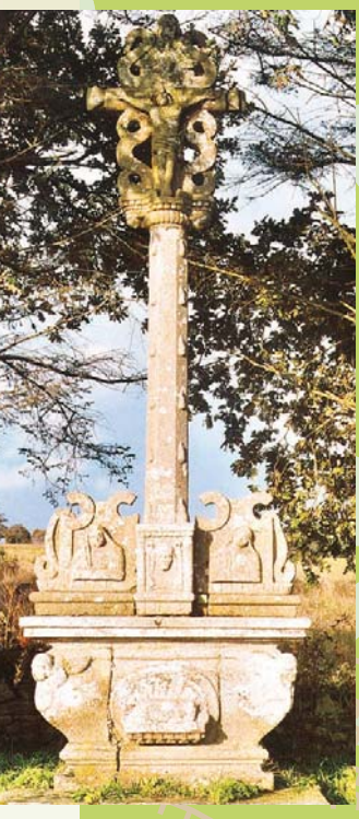
Carrière de la Lande